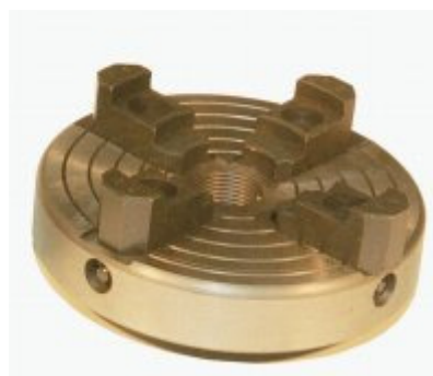
Mandrino a 4 griffe, autocentrante, Diametro 100 mm.