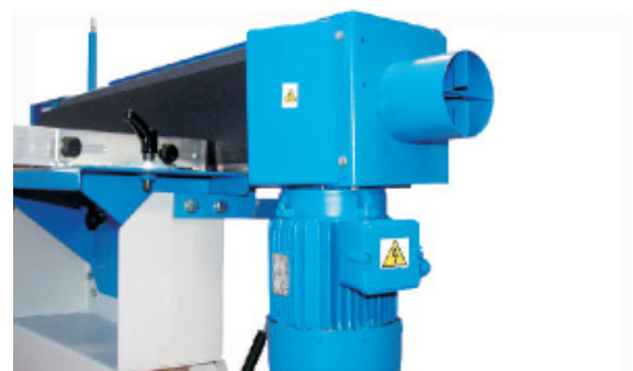
Motorleistung 1,5 kW - Absaughaube Potenza motore 1,5 kW - bocca aspirante Motor power 1,5 kW - exhaust hood