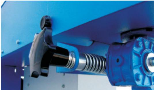
Mechanische Oszillation Impostazione oscillazione meccanica Mechanical adjustment of oscilation