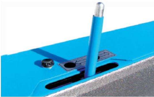
Bandspannung Tensionamento nastro Mechanical belt stretching