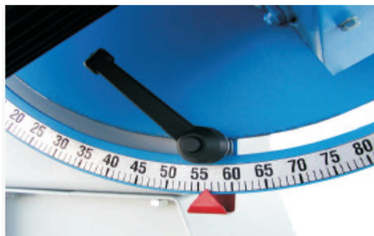
Schwenkbares Aggregat 0-90° Testa inclinabile 0-90° Tilting worktable 0-90°