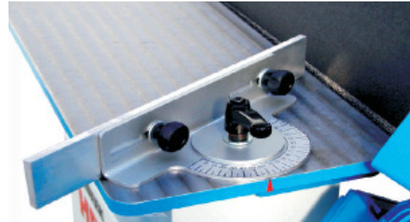
Winkelanschlag Squadro Working table with turning rule